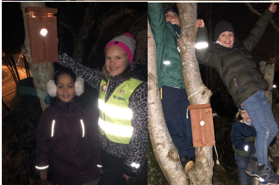
Øverste bilde: Barnekoret med foreldre, samt sangkoret Metone Nederste to: Speiderjenter og gutter som har hengt opp fuglekasser